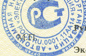
Схема сертификации За